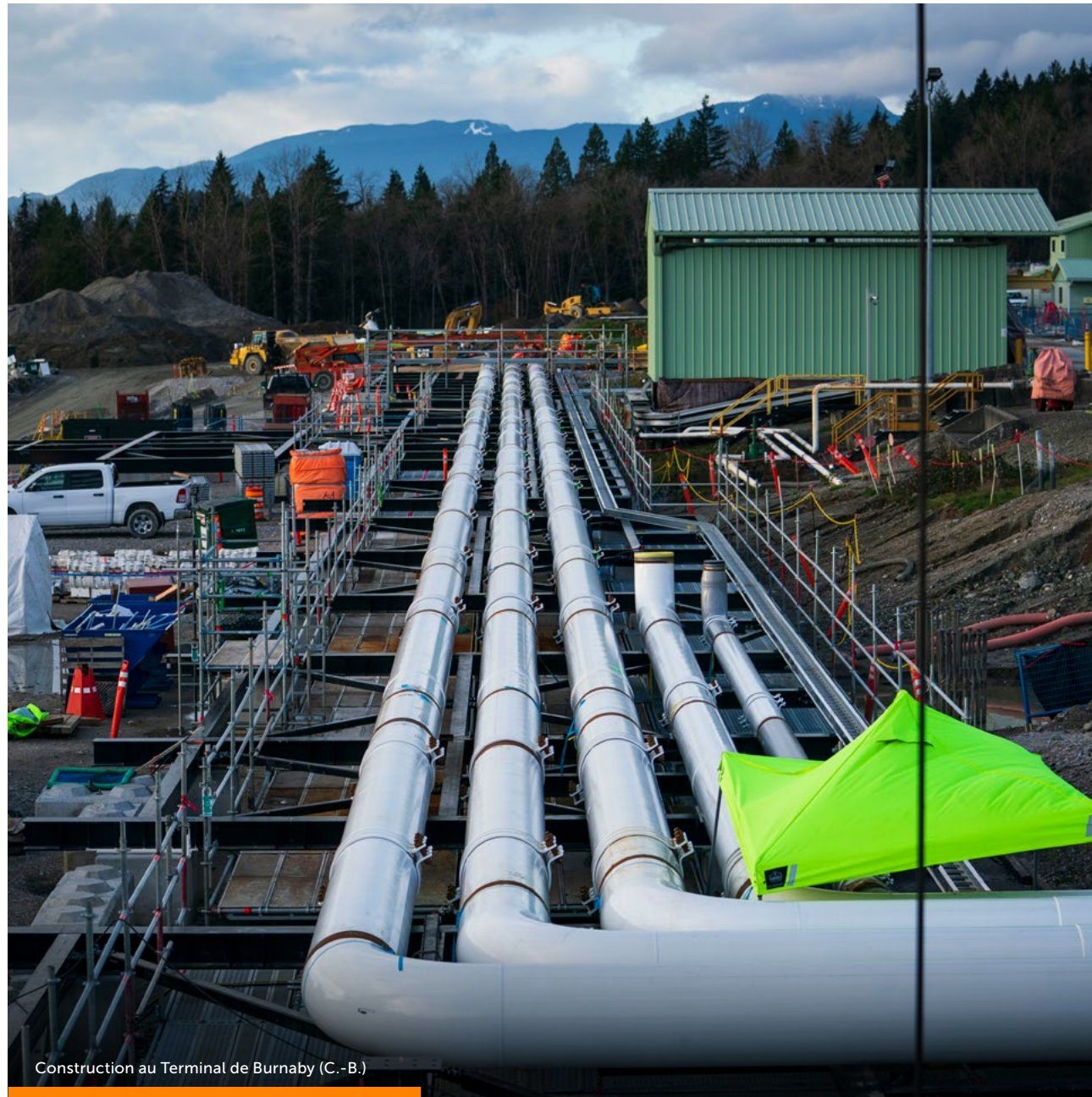
Construction au Terminal de Burnaby (C.-B.)