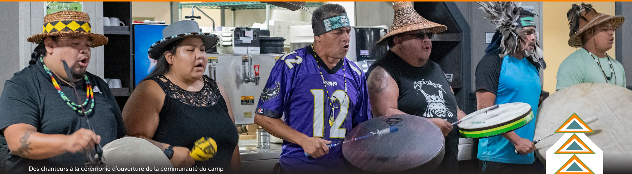
Des chanteurs à la cérémonie d'ouverture de la communauté du camp

Les employés ont insisté sur le fait qu'une formation visant à renforcer leur confiance dans les contextes interculturels améliorerait la communication avec les partenaires autochtones, favoriserait la prise de décision basée sur la collaboration et aiderait à éviter les malentendus et les conflits.