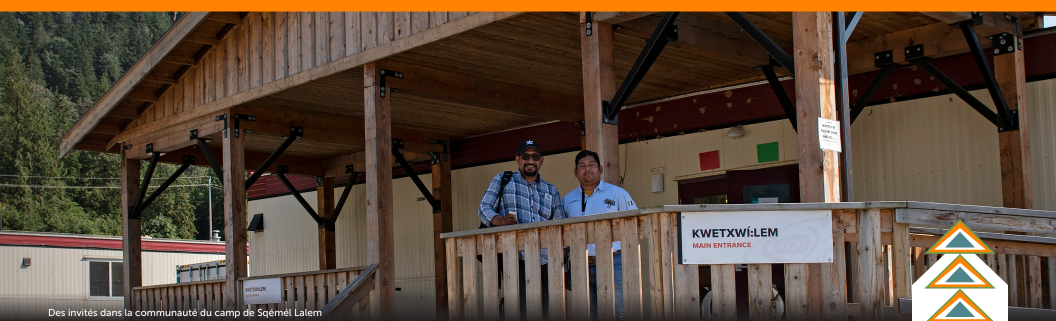
Des invités dans la communauté du camp de Sqémél Lalem

Les participants ont exprimé leur satisfaction quant à la bonne intégration de l'équipe de Trans Mountain chargée de la chaîne d'approvisionnement autochtone et ont manifesté leur intérêt à élargir les possibilités d'approvisionnement autochtone à des domaines plus techniques comme l'archéologie et les services environnementaux.