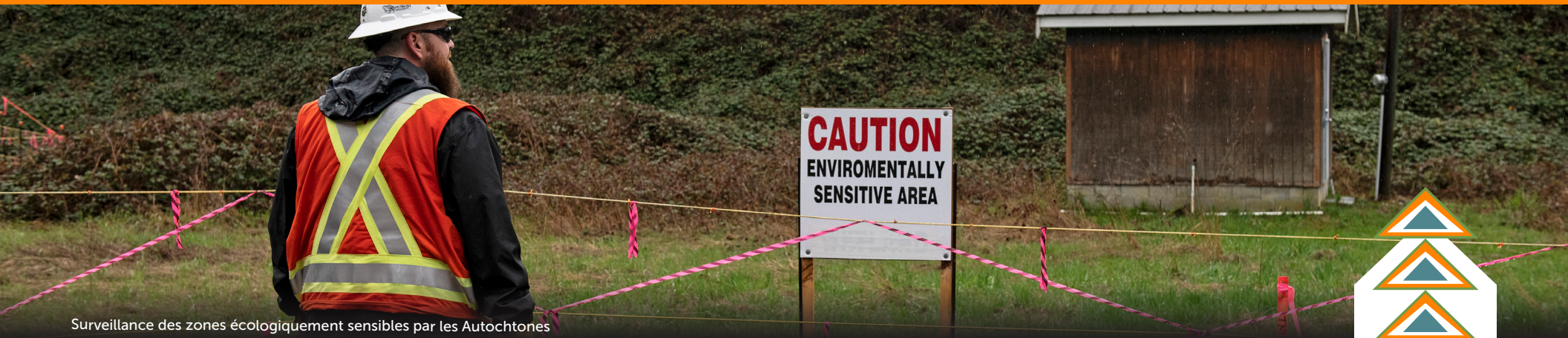
Surveillance des zones écologiquement sensibles par les Autochtones

Les participants ont souligné que la participation des peuples autochtones à la vérification de la santé des océans et de la salubrité des aliments récoltés est d'une importance capitale. Cet engagement a été considéré comme contribuant non seulement à la protection de l'environnement, mais aussi comme un élément crucial de la prise en compte des droits et des titres des populations autochtones.