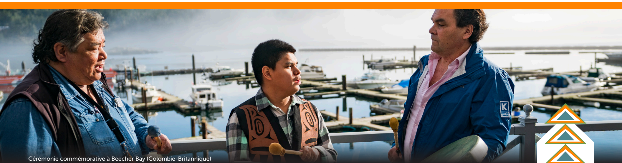
Cérémonie commémorative à Beecher Bay (Colombie-Britannique)

Les participants ont reconnu la valeur de l'engagement informel, qui comprend une communication directe pendant les événements critiques. Certaines communautés ont exprimé un vif intérêt à participer activement à l'élaboration des plans d'intervention d'urgence de Trans Mountain et ont souligné l'importance de la participation des communautés à la sécurité et à la préparation.