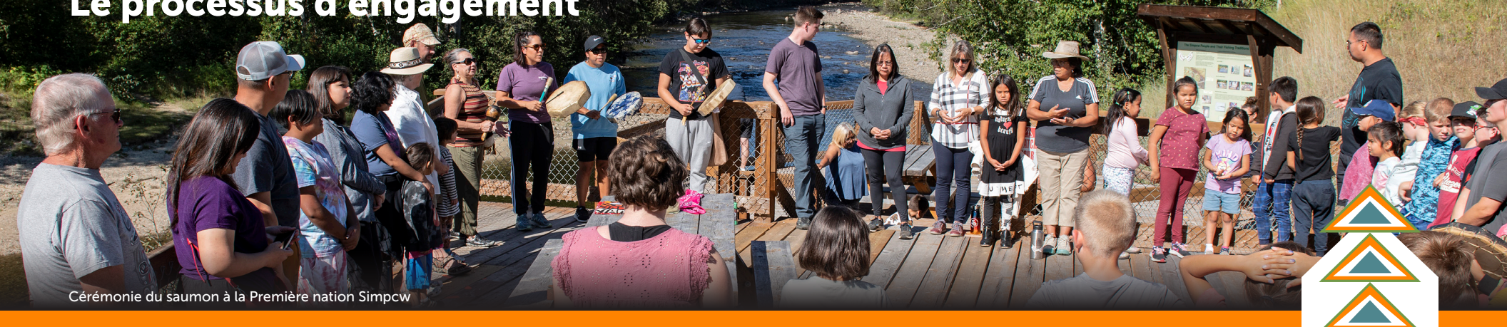
Cérémonie du saumon à la Première nation Simpcw