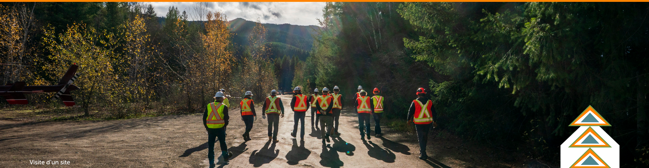
Visite d'un site

Les participants ont également souligné l'importance de s'engager auprès des élèves dès le secondaire afin de leur présenter les possibilités de carrière dans l'industrie. Au cours des séances, on a aussi soulevé la question de la représentation autochtone au niveau de la direction, et les participants ont discuté des possibilités d'aider les employés à passer du statut de membre de la main-d'œuvre à celui de superviseur ou de directeur.